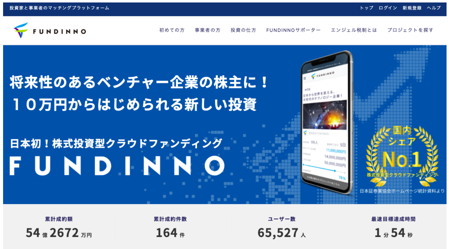
図1 FUNDINNOのWebページ( https://fundinno.com/ )より