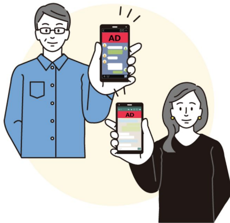
▲ SNS広告をエリアごとに効果検証

データで課題がどこにあるのかを明確にした上で、最も効果が期待できる地域・ユーザー層にSNS広告を配信